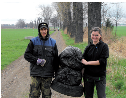
Nahoře: Jarní úklid obce Vlevo: Co jsme také našli v bioodpadu Dole: Stavba nového plotu u kluziště