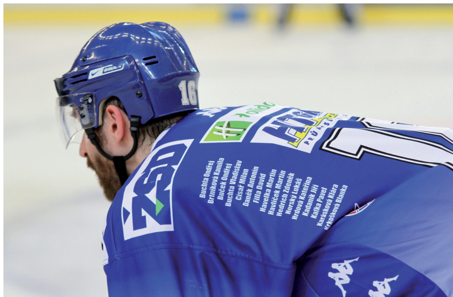
Jiříkovští dárci krve na dresech Komety Brno