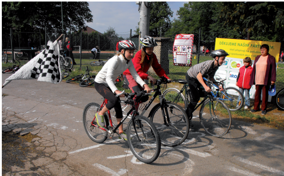
Cyklistický závod s netradičními disciplínami - 2. června