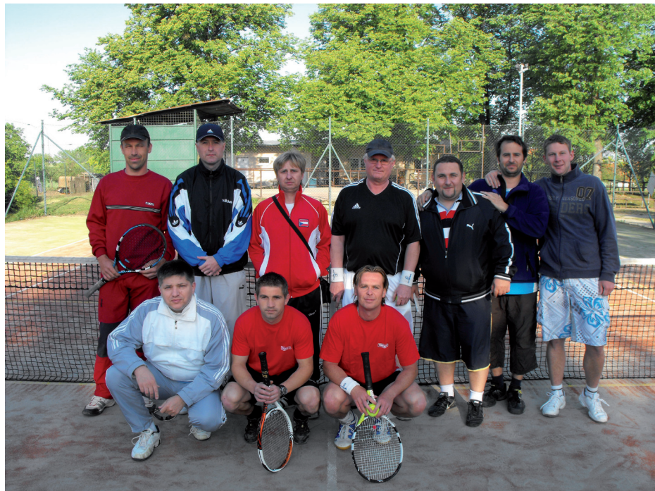
Losovaný tenisový turnaj - 19. května