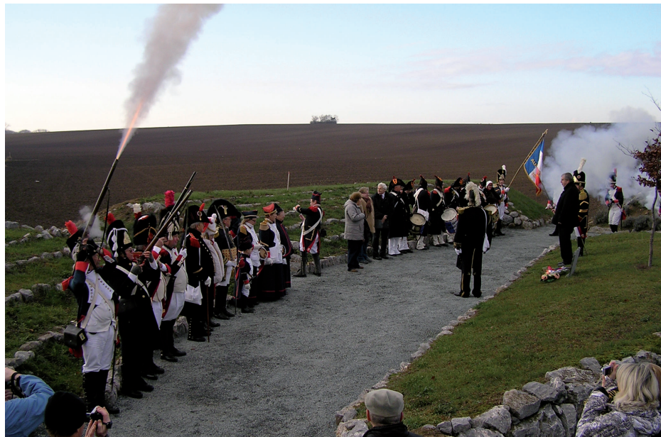
Pietní vzpomínky na 207. výročí bitvy u Slavkova