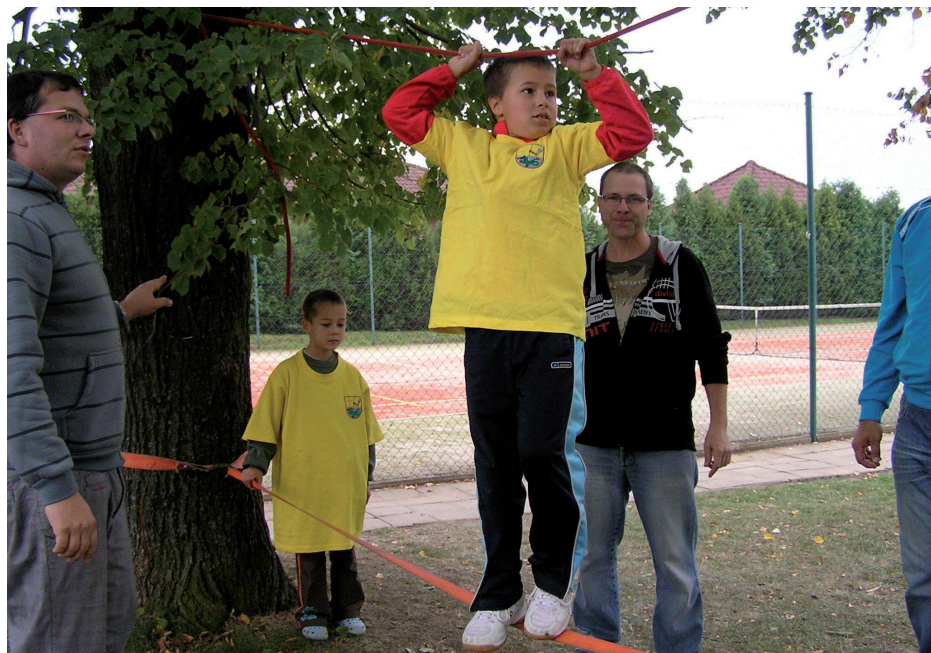
Nahoře: Dětská olympiáda Dole: Rozsvícení vánočního stromu