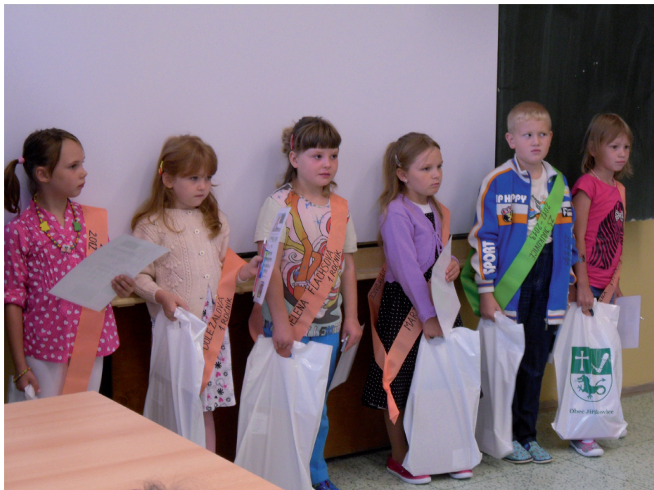
Zahájení školního roku na Základní škole

Všem školákům, studentům a učitelům přejeme mnoho úspěchů v novém školním roce!