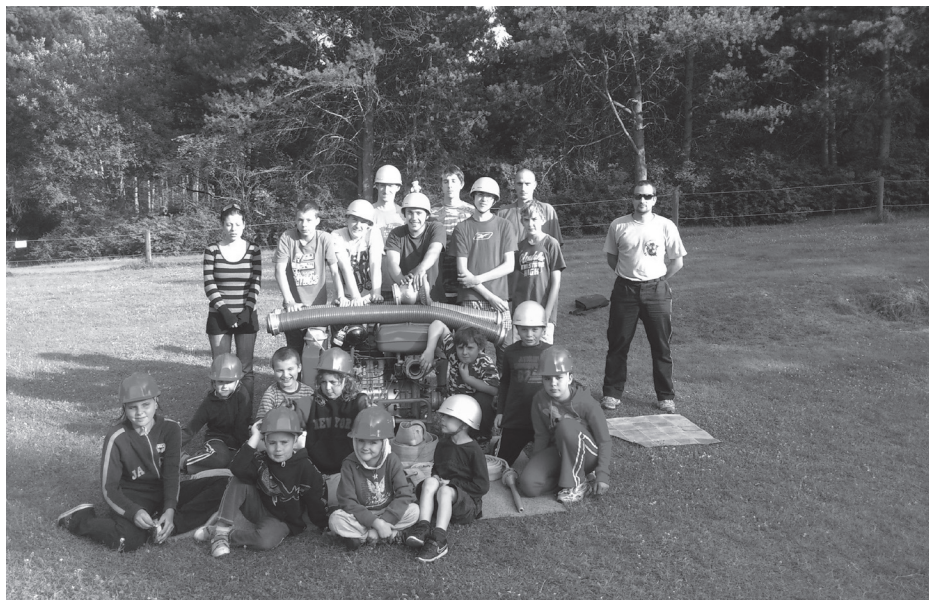
Hasičský tábor (nahore) a následky vichřice ze 6.7.2012