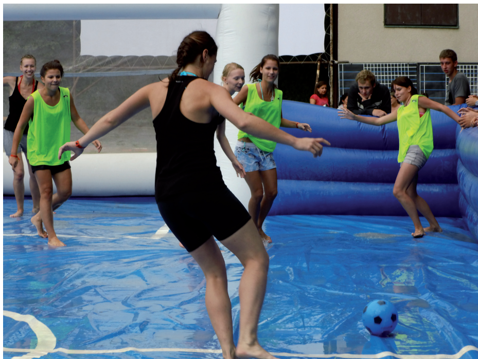
Nahore: Hasičský víkend Dole: Beseda s Kometou