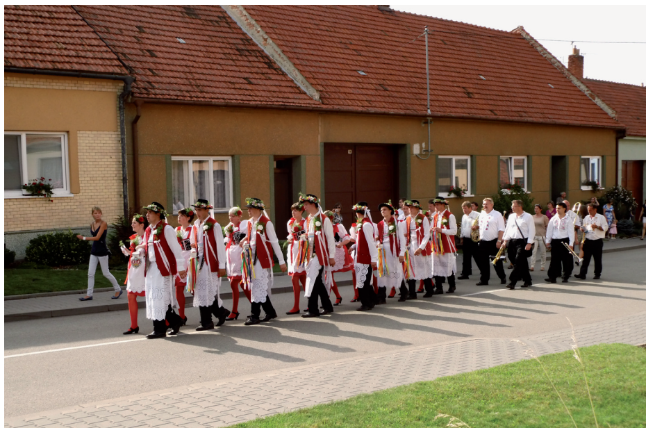
Nahoře: Jiříkovské hody Dole: Výstava drůbeže