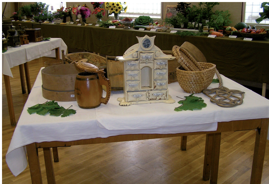
Podzimní výstava se soutěží „Jiříkovský štrůdl“