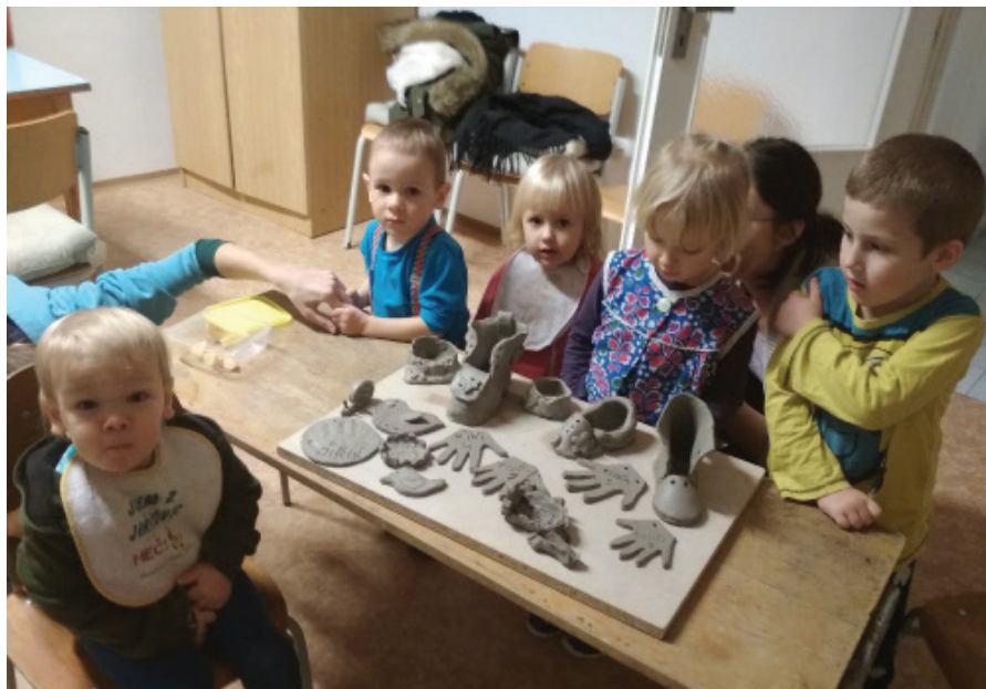
Klub dětí Novoroční běh pro Krtka