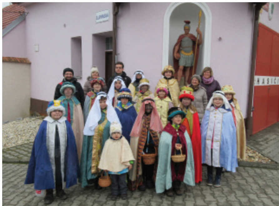
Tříkrálová sbírka - 6.1.2018 Tradiční Jiříkovské ostatky - foto: Radek Říčánek