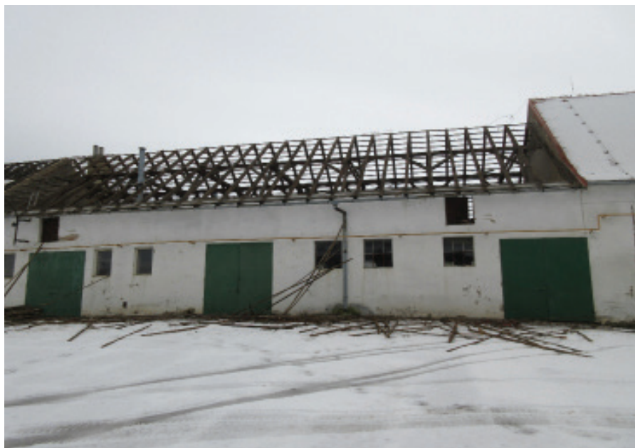
Bourací práce v Panském dvoře před stavbou tělocvičny - leden 2018