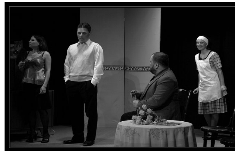
divadlo STODOLA Jiřkovice, foto z premiéry hry Mrtvý přišel na návštěvu