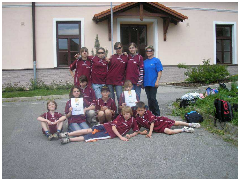
Jednota Orel Jiříkovice a její mladí sportovci