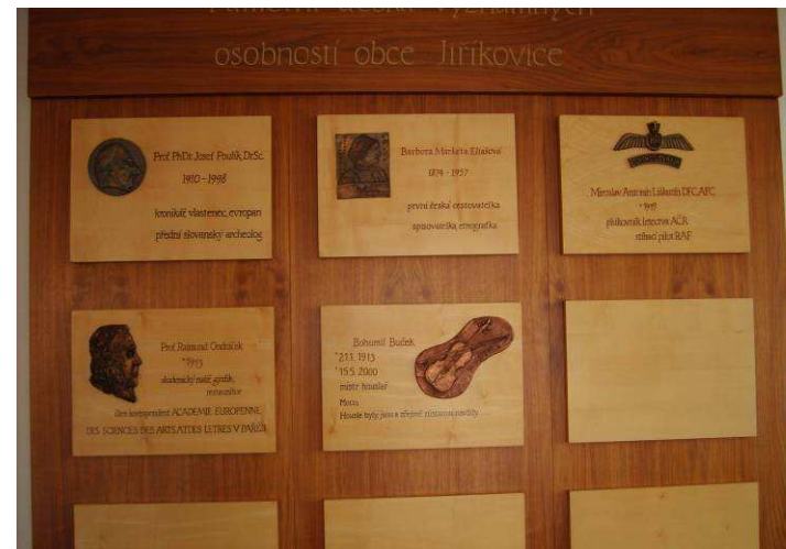
Pamětní deska panu Bohumilu Bučkovi