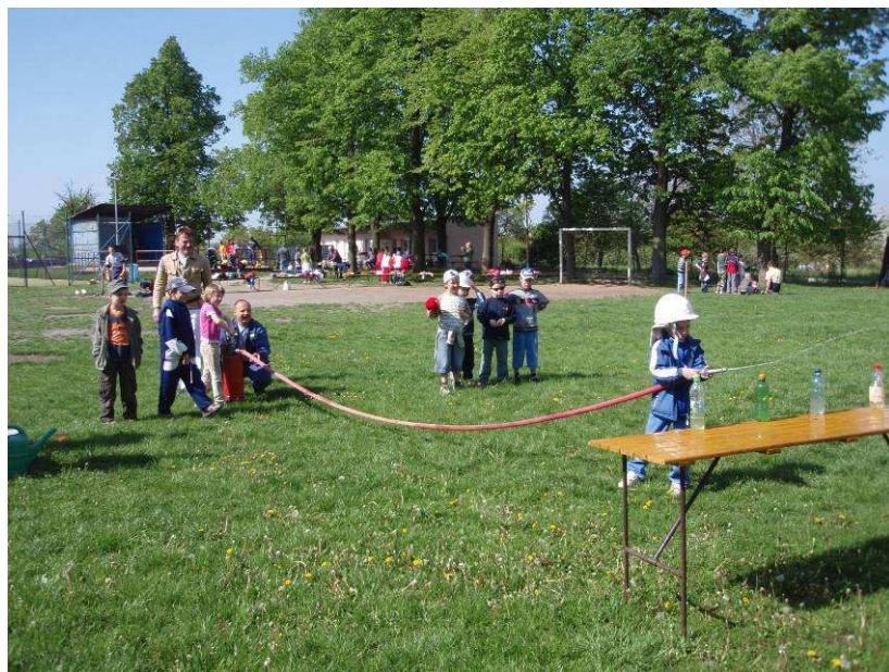
Den se sborem dobrovolných hasičů Jiříkovice