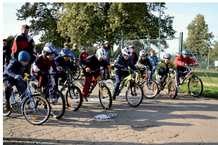
Cyklistický závod (5.10.)