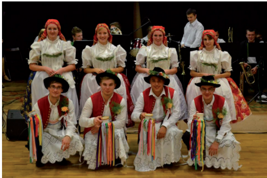
Martinské hody - 9.11.2013 (nahore) Slaměný betlém u mateřské školy (dole)