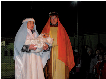
Rozsvícení vánočního stromu, zahájení výstavy betléma a rozsvícení obecního adventního věnce (30.11.)