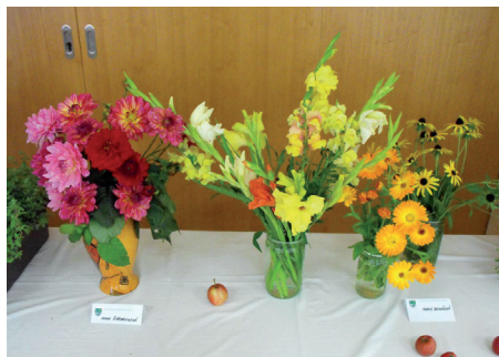
Podzimní výstava (20. - 22.9.)