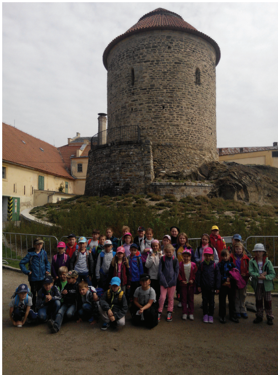
Základní škola na výletě ve Znojmě (10. 9. 2015)