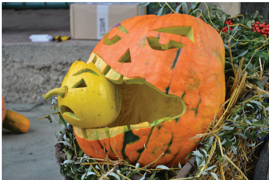
Jiříkovská dýně (18. 9. 2015) Podzimní výstava (12. - 13. 9. 2015)