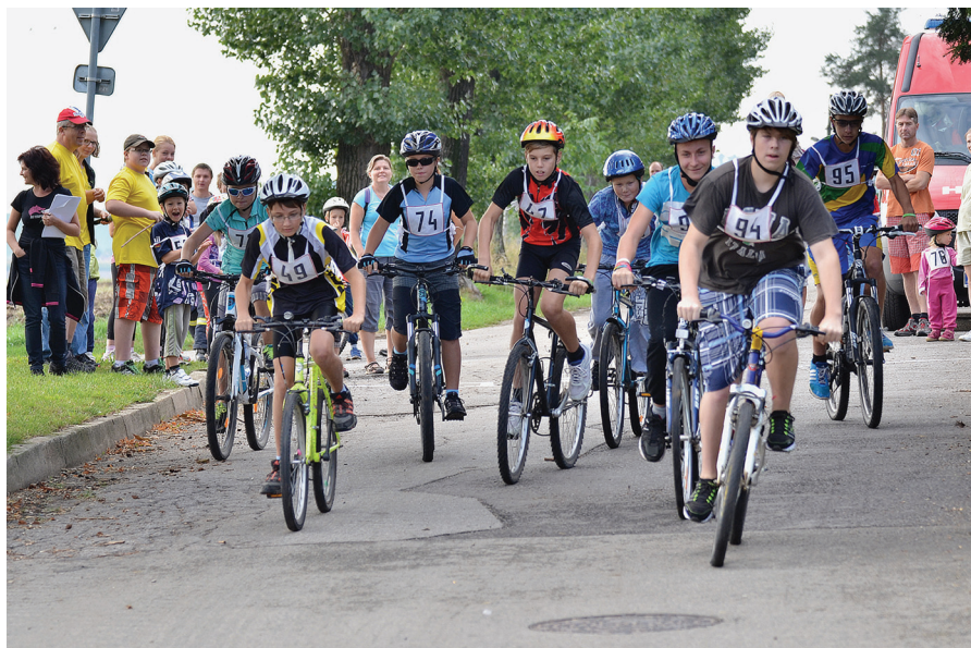
Cyklistický závod dětí a doprovodné soutěže (5. 9. 2015)