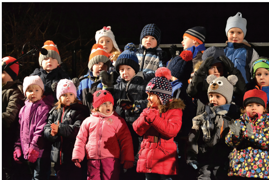
Rozsvícení vánočního stromu (28. 11. 2015)