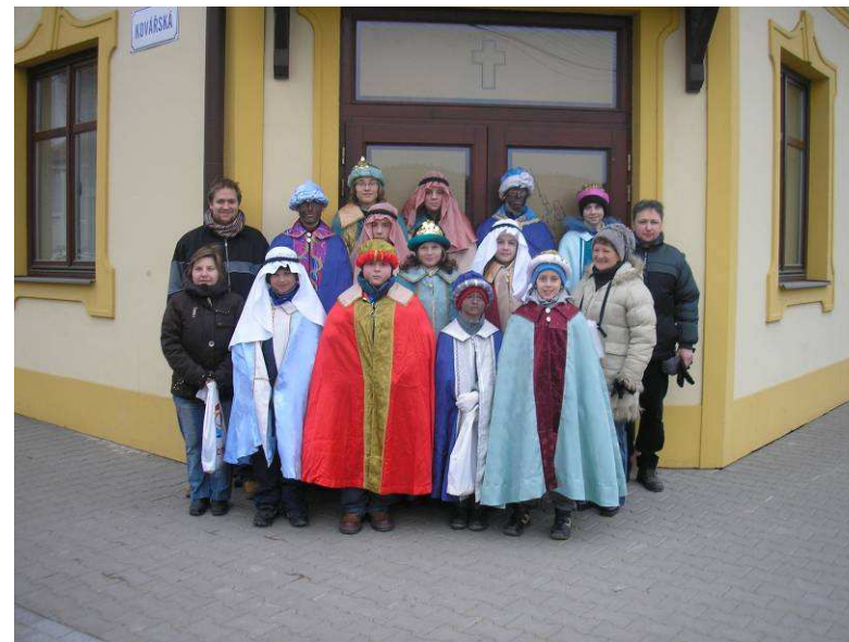
TŘÍKRÁLOVÁ SBÍRKA 5.1.2008

Své příspěvky a názory můžete poslat písemně na Obecní úřad nebo elektronickou poštou na tuto e-mailovou adresu: ou.jirikovice@volny.cz